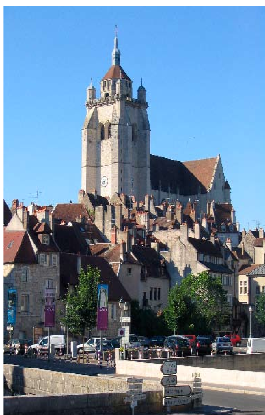
The church in Dole