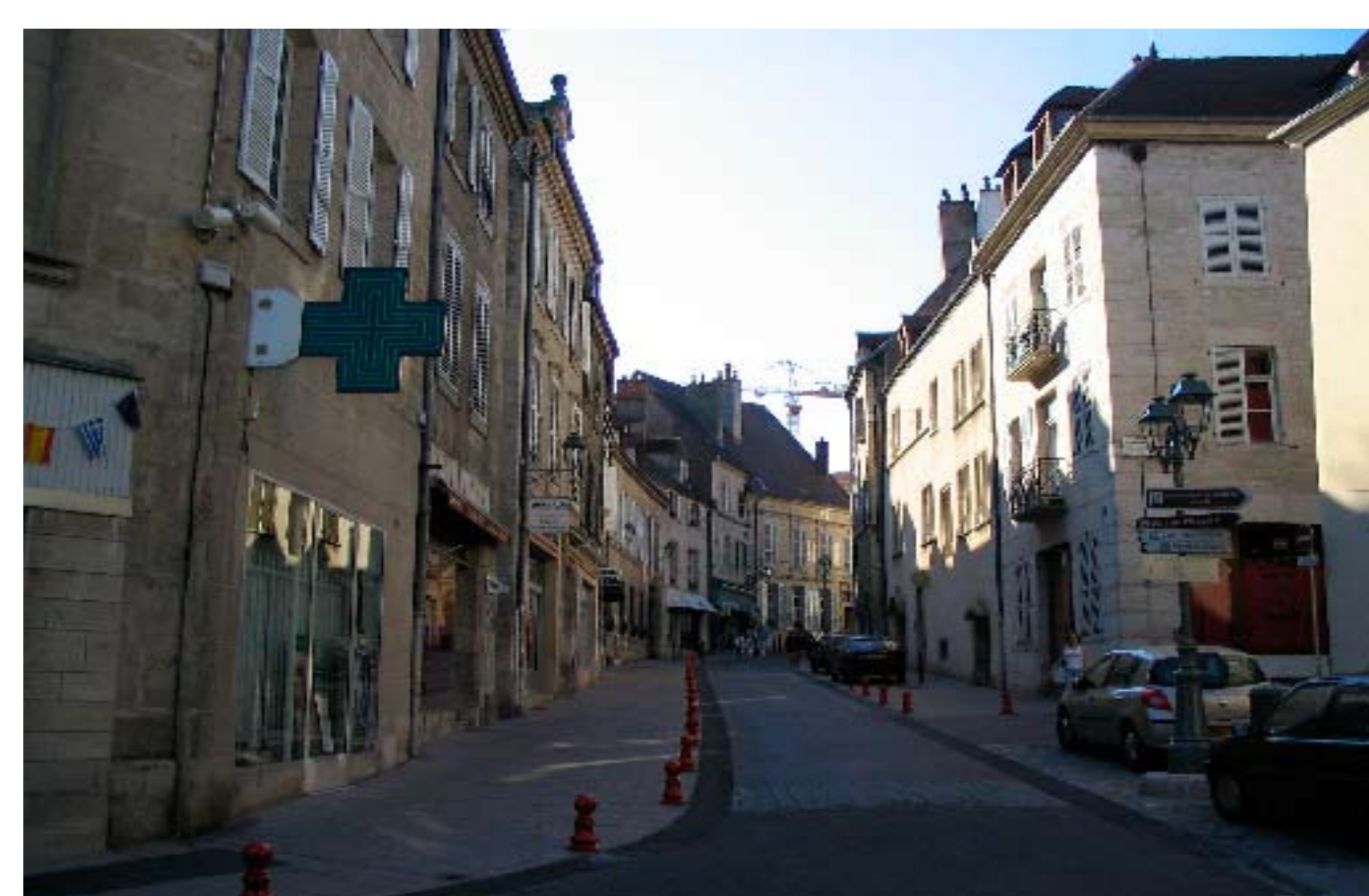
A street in Dole